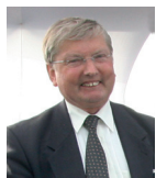
Marc DELANNOY Président de la Communauté de communes Flandre Lys

Lors du conseil communautaire du 16 décembre dernier, les élus ont voté une augmentation de 10,8% des tarifs de la redevance incitative des ordures ménagères (REOM) pour 2011.