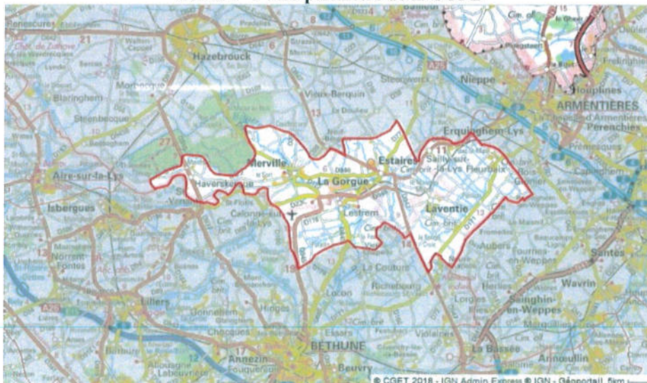
Carte n° 1 : Le périmètre de la CCFL