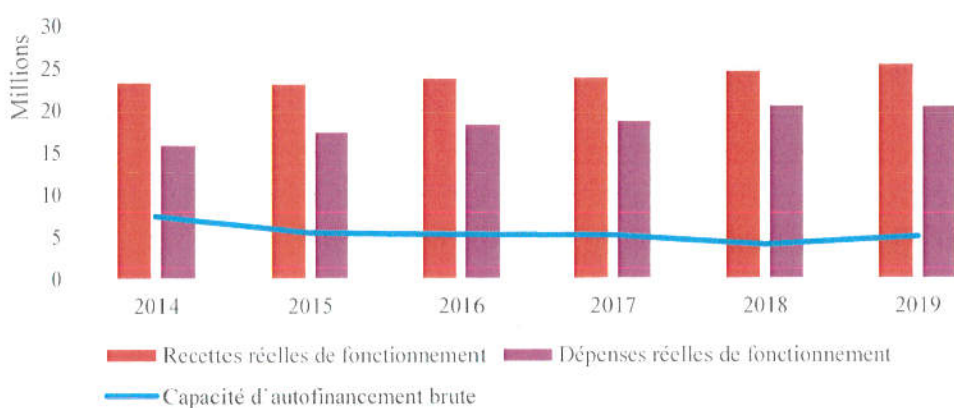
Graphique n° 1 : Évolution de l'épargne brute entre 2014 et 2019